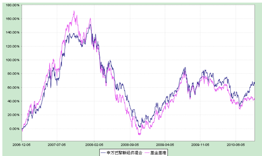
基金累计净值增长率与业绩比较基准收益率的历史走势对比

2. 自《基金合同》生效以来基金份额累计净值增长率与同期业绩比较基准的变动比较。