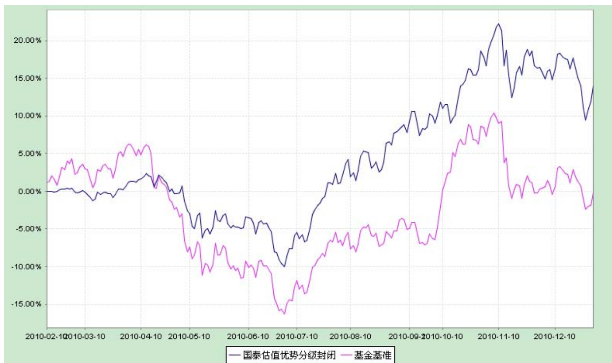
国泰估值优势可分离交易股票型证券投资基金 份额累计净值增长率与业绩比较基准收益率历史走势对比图 (2010年2月10日至2010年12月31日)

注：1、本基金合同于2010年2月10日生效，截止报告日本基金合同生效未满一年。 2、本基金在六个月建仓结束时，各项资产配置比例符合合同约定。