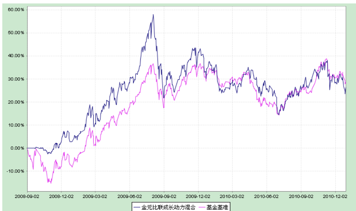
金元比联成长动力灵活配置混合型证券投资基金 份额累计净值增长率与业绩比较基准收益率历史走势对比图 (2008年9月3日至2010年12月31日)

注：(1) 本基金合同生效日为 2008 年 9 月 3 日，基金合同生效未满一年；基准累计增长率以 2008 年 9 月 2 日指数为基准；