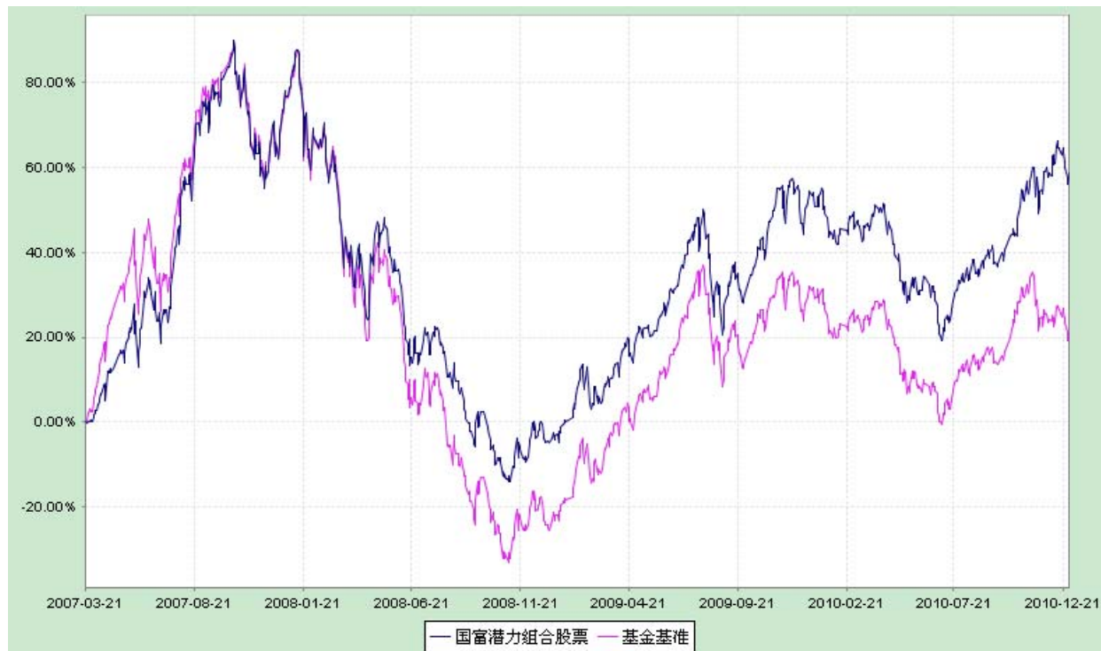
富兰克林国海潜力组合股票型证券投资基金 份额累计净值增长率与业绩比较基准收益率历史走势对比图 (2007 年 3 月 22 日至 2010 年 12 月 31 日)

注：1、本基金的基金合同生效日为 2007 年 3 月 22 日。本基金在 6 个月建仓期结束时，各项投资比例符合基金合同约定。