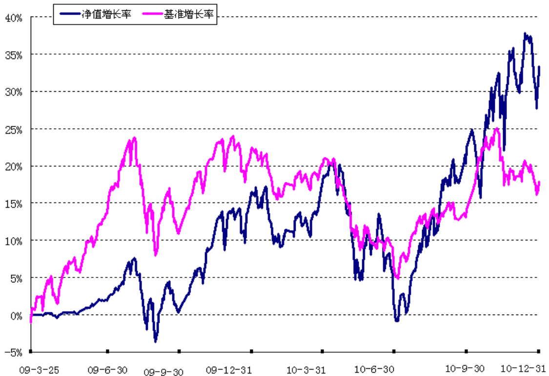
兴全有机增长灵活配置混合型证券投资基金 份额累计净值增长率与业绩比较基准收益率历史走势对比图 (2009 年 3 月 25 日至 2010 年 12 月 31 日)