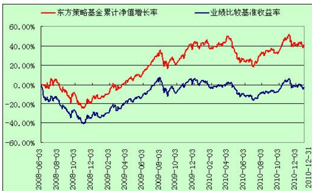
东方策略成长股票型开放式证券投资基金 份额累计净值增长率与业绩比较基准收益率历史走势对比图 (2008年6月3日至2010年12月31日)