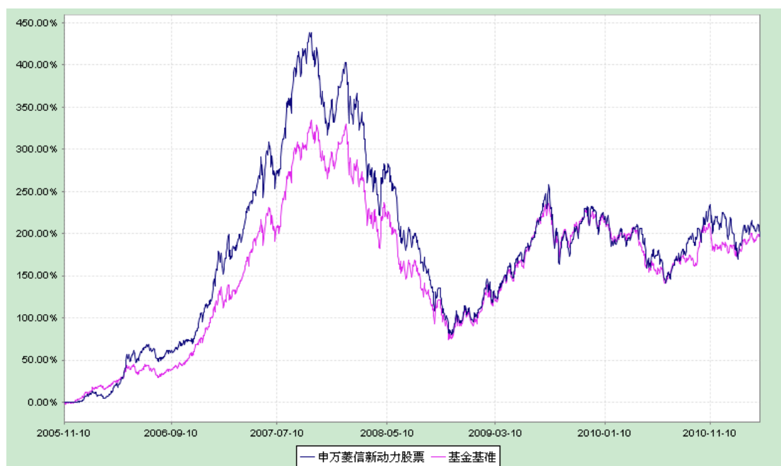
基金累计净值增长率与业绩比较基准收益率的历史走势对比

2. 自《基金合同》生效以来基金份额累计净值增长率与同期业绩比较基准的变动比较。