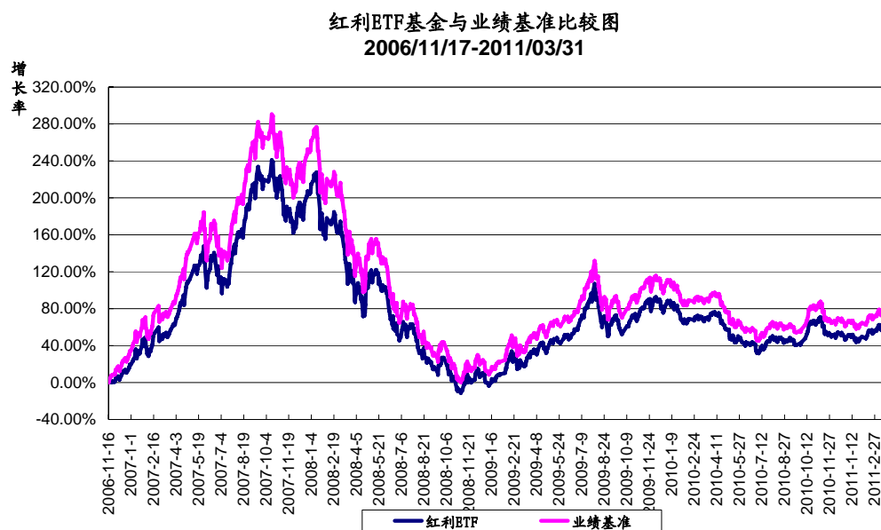
红利ETF基金累计份额净值增长率与同期业绩比较基准收益率的历史走势对比图二 ----自建仓完毕日起至本报告期末（跟踪期间）