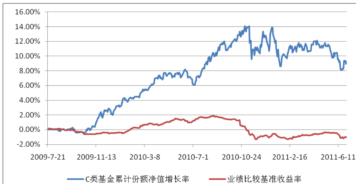
收益率的历史走势对比图（分级 C）

注：根据民生加银增强收益债券型证券投资基金的基金合同规定，本基金自基金合同生效之日起 6 个月内使基金的投资组合比例符合本基金合同第十二条（二）投资范围、（八）投资限制的有关约定。