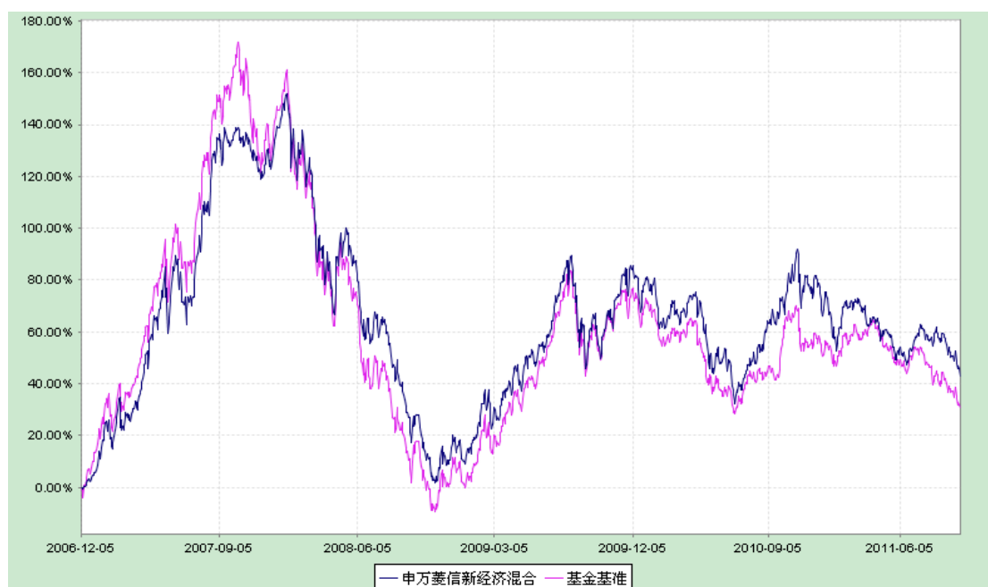
基金累计净值增长率与业绩比较基准收益率的历史走势对比

2. 自《基金合同》生效以来基金份额累计净值增长率与同期业绩比较基准的变动比较。