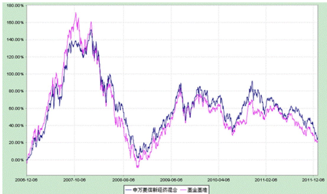
申万菱信新经济混合型证券投资基金 份额累计净值增长率与业绩比较基准收益率历史走势对比图 （2006 年 12 月 6 日至 2011 年 12 月 31 日）

注：根据本基金基金合同，本基金股票（含权证）投资比例为基金净资产的 45%至 95%，一般情况下为 80%至 95%，当基金管理人通过详细论证认为股市步入下跌阶段时，可以将股票投资比例调至 80%以下（最小可以至 45%）；权证投资比例为基金净资产的 0%至 3%；债券和现金类与货币市场工具投资比例为基金净资产的 5%以上，通常为 5%至 20%，其中现金类及货币市场工具为基金净资产的 5%以上。上述投资比例限制自基金合同生效 6 个月起生效。基金合同生效满 6 个月时，本基金已达到上述比例限制。