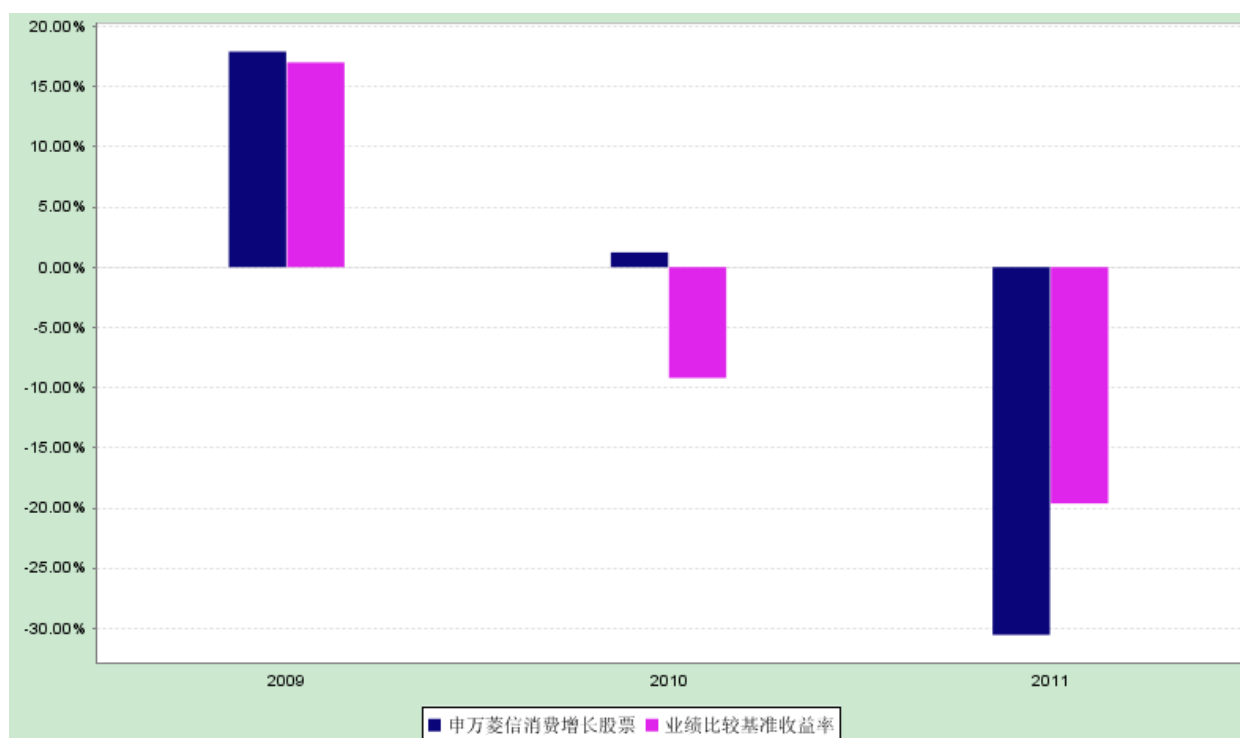
自基金合同生效以来每年净值增长率图

注：2009 年数据按基金合同生效后基金实际存续期计算，未按整个自然年度进行折算。