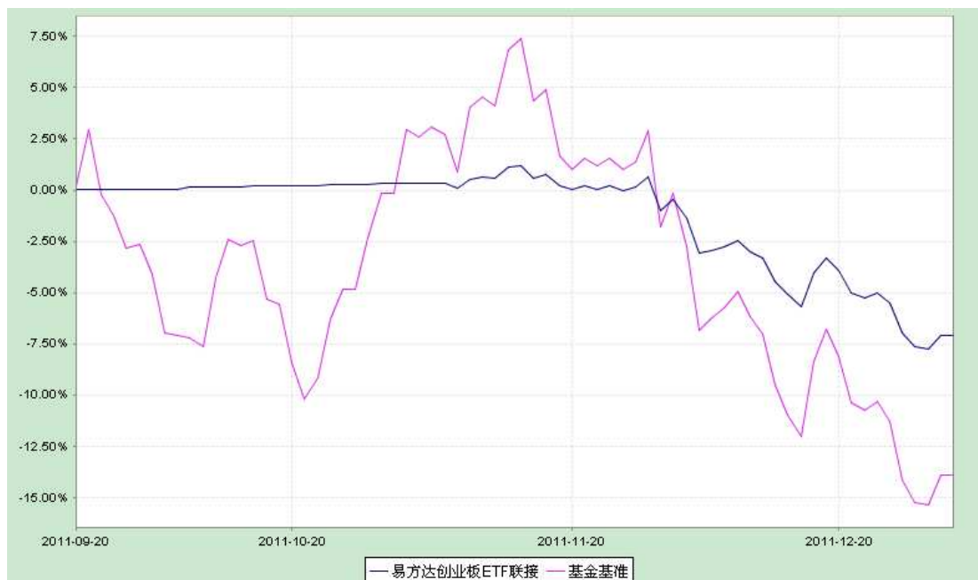
易方达创业板交易型开放式指数证券投资基金联接基金 份额累计净值增长率与业绩比较基准收益率历史走势对比图 (2011 年 9 月 20 日至 2011 年 12 月 31 日)

注：1. 本基金合同于 2011 年 9 月 20 日生效，截至报告期末本基金合同生效未满一年。