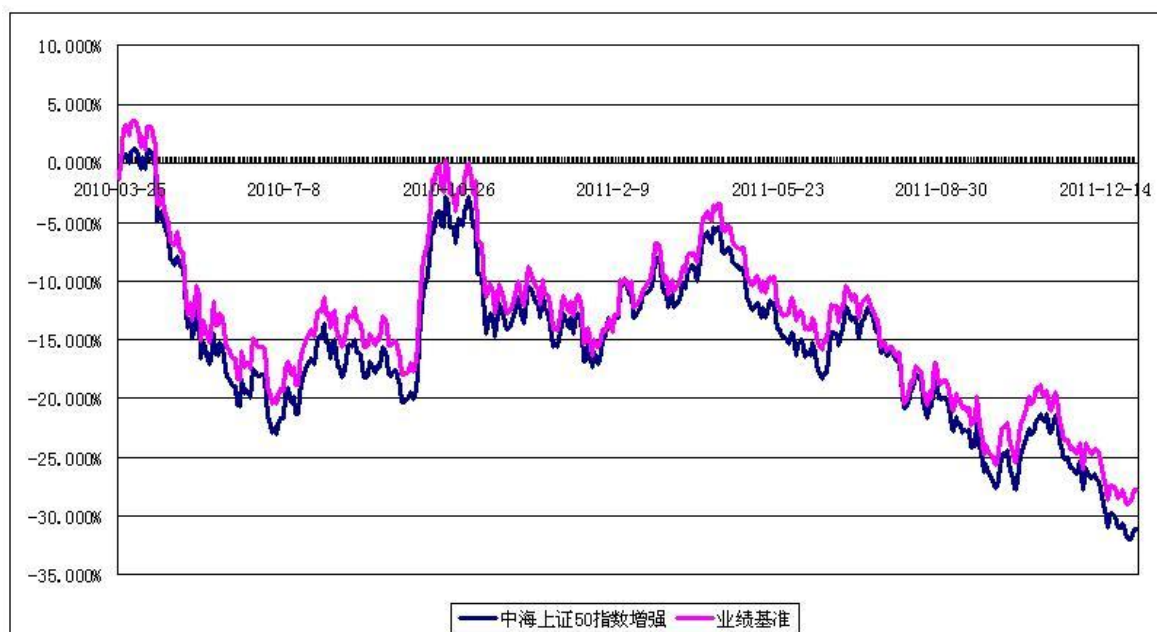
中海上证 50 指数增强型证券投资基金 份额累计净值增长率与业绩比较基准收益率历史走势对比图 （2010 年 3 月 25 日至 2011 年 12 月 31 日）