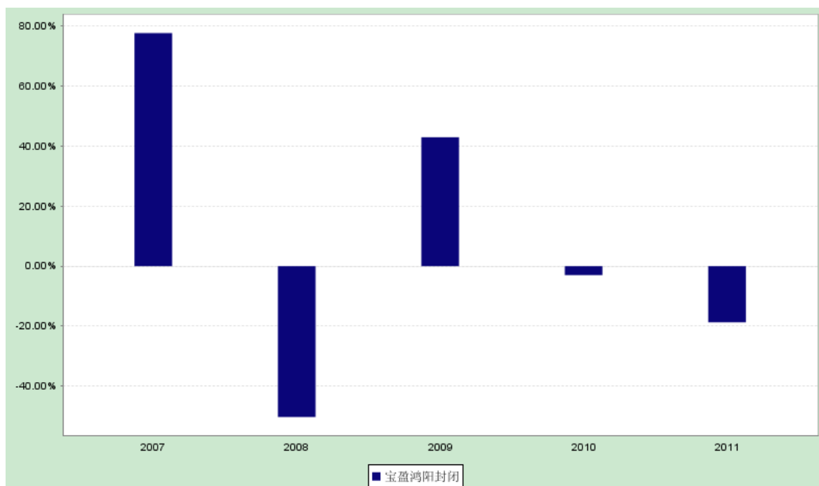
过去五年基金净值增长率与业绩比较基准收益率的对比图