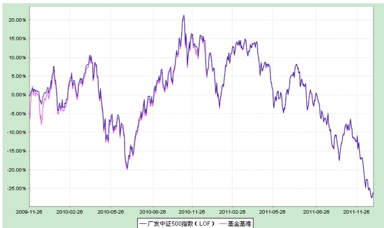
广发中证 500 指数证券投资基金 (LOF) 份额累计净值增长率与业绩比较基准收益率历史走势对比图 (2009 年 11 月 26 日至 2011 年 12 月 31 日)