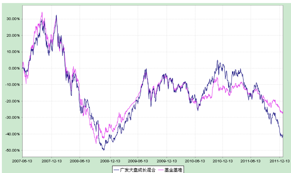
广发大盘成长混合型证券投资基金 份额累计净值增长率与业绩比较基准收益率历史走势对比图 (2007 年 6 月 13 日至 2011 年 12 月 31 日)