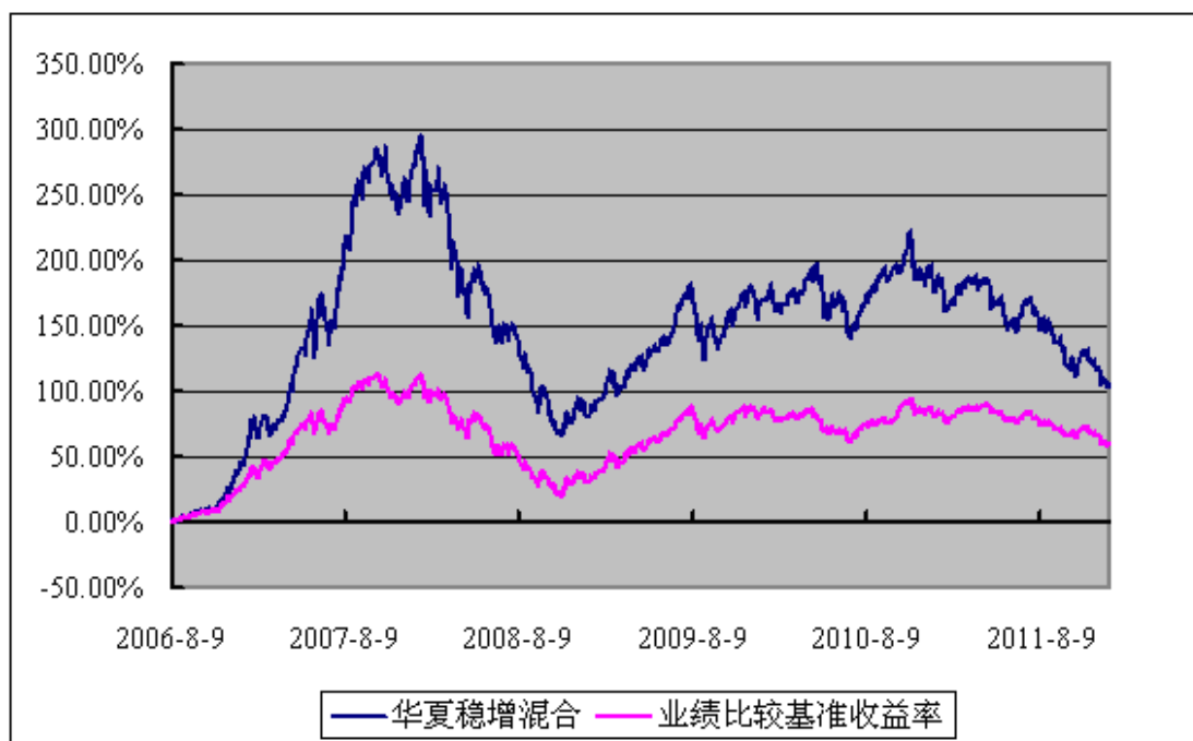
华夏平稳增长混合型证券投资基金 份额累计净值增长率与业绩比较基准收益率历史走势对比图 (2006年8月9日至2011年12月31日)

注：自 2006 年 8 月 9 日起，由《兴业证券投资基金基金合同》修订而成的《华夏平稳增长混合型证券投资基金基金合同》生效。