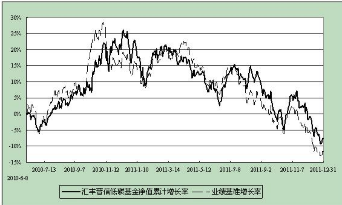
汇丰晋信低碳先锋股票型证券投资基金 份额累计净值增长率与业绩比较基准收益率历史走势对比图 (2010年6月8日至2011年12月31日)

注：1. 按照基金合同的约定，本基金的投资组合比例为：股票投资比例范围为基金资产的 85%-95%，权证投资比例范围为基金资产净值的 0%-3%。固定收益类证券、现金和其他资产投资比例范围为基金资产的 5%-15%，其中现金或到期日在一年以内的政府债券的投资比例不低于基金资产净值的 5%。本基金自基金合同生效日起不超过六个月内完成建仓。截止 2010 年 12 月 8 日，本基金的各项投资比例已达到基金合同约定的比例。