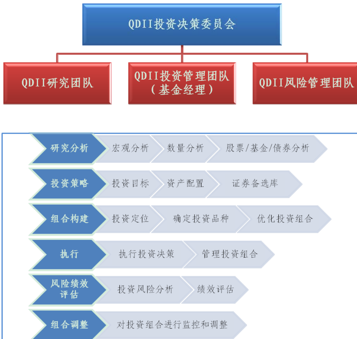
图 2: QDII 投资决策机制和投资管理流程

在投资过程中, QDII投资决策委员会、QDII基金经理和投资队伍各职能小组的工作关系参见图2: