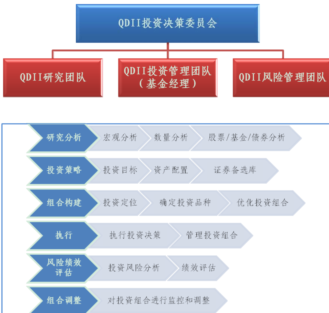
图 2: QDII 投资决策机制和投资管理流程