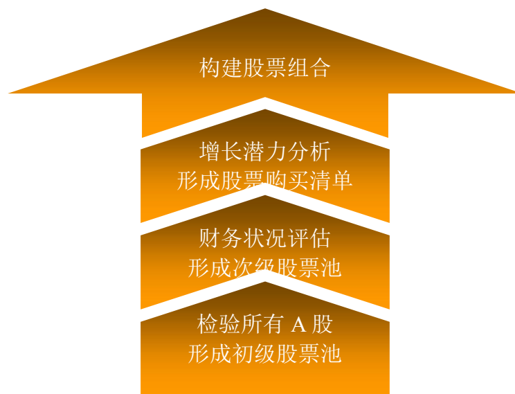
图：本基金选股流程

本基金基金经理将对股票购买清单上的股票进行逐一分析和比较，挑选出其中股价下跌风险最低且上涨空间最大的股票构建具体的股票组合。