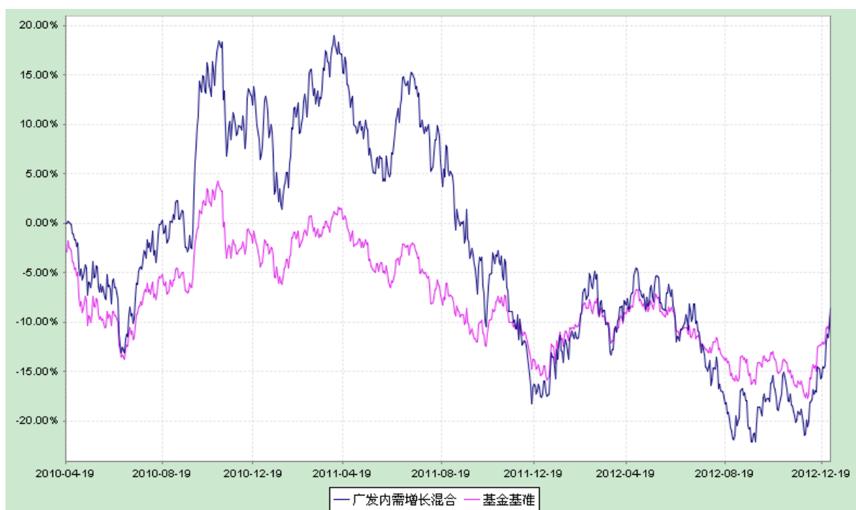
广发内需增长灵活配置混合型证券投资基金 份额累计净值增长率与业绩比较基准收益率历史走势对比图 (2010 年 4 月 19 日至 2012 年 12 月 31 日)