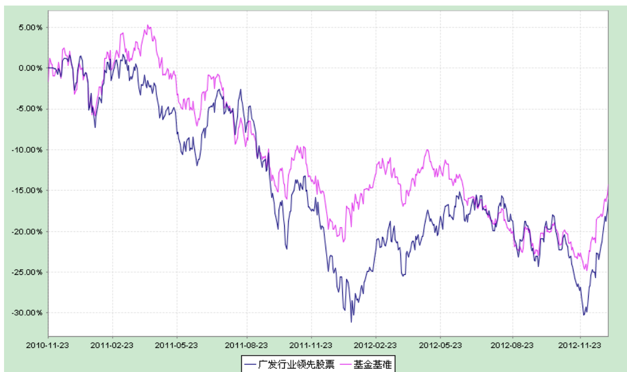
广发行业领先股票型证券投资基金 份额累计净值增长率与业绩比较基准收益率历史走势对比图 (2010 年 11 月 23 日至 2012 年 12 月 31 日)