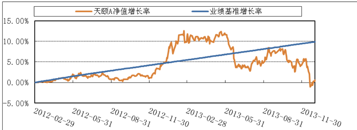
博时天颐债券 C 类