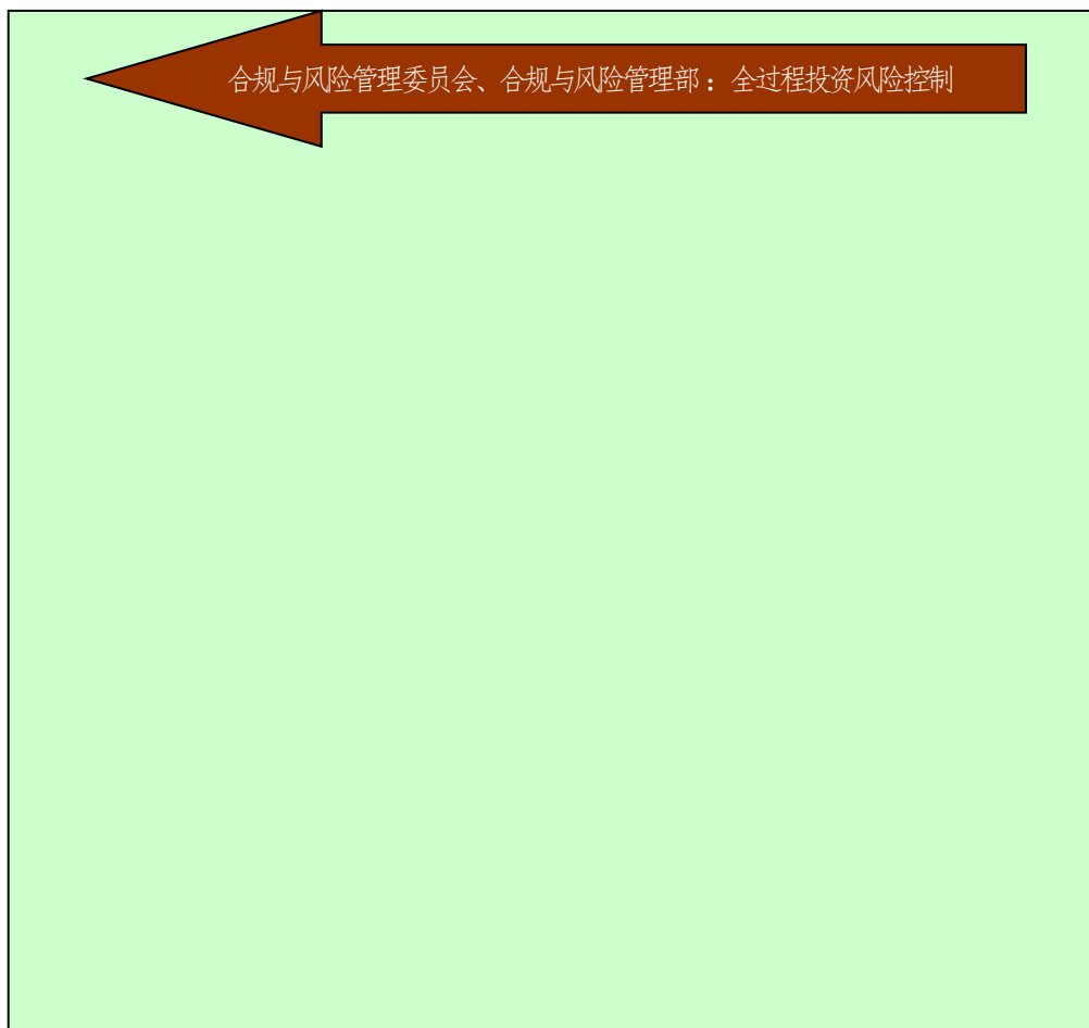
图1 东方红-新睿3号投资管理流程图

严格、明确的投资流程是本集合计划控制投资风险，进行组合投资的制度保障。本计划采取投资决策委员会领导下的投资主办人负责制，具体为投资决策委员会对集合计划投资组合做出战略性资产配置等重大决策；投资主办人在研究部对具体投资品种的深入研究并提出投资建议的前提下，进行战术性的投资操作，最后，集合计划管理人设有专门的合规与风险管理部门，对集合计划投资组合进行全方位、全过程的监测和管理。具体流程见图1：