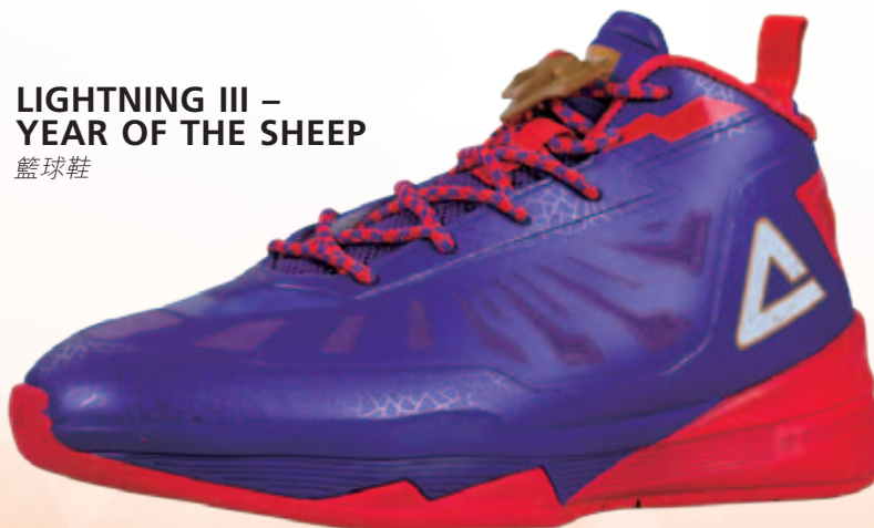
LIGHTNING III – YEAR OF THE SHEEP 籃球鞋

鞋類產品於2014年的售出數量有所增加，主要歸因於年內中國市場對籃球以及跑步鞋類產品的需求增加。該等需求增加主要歸因於本集團於年內的有效市場推廣。2014年服裝產品售出數量下跌主要原因是本集團於年內停止對分銷商提供服裝產品的特別折扣，而該特別折扣於2013年提高了服裝產品的售出數量。