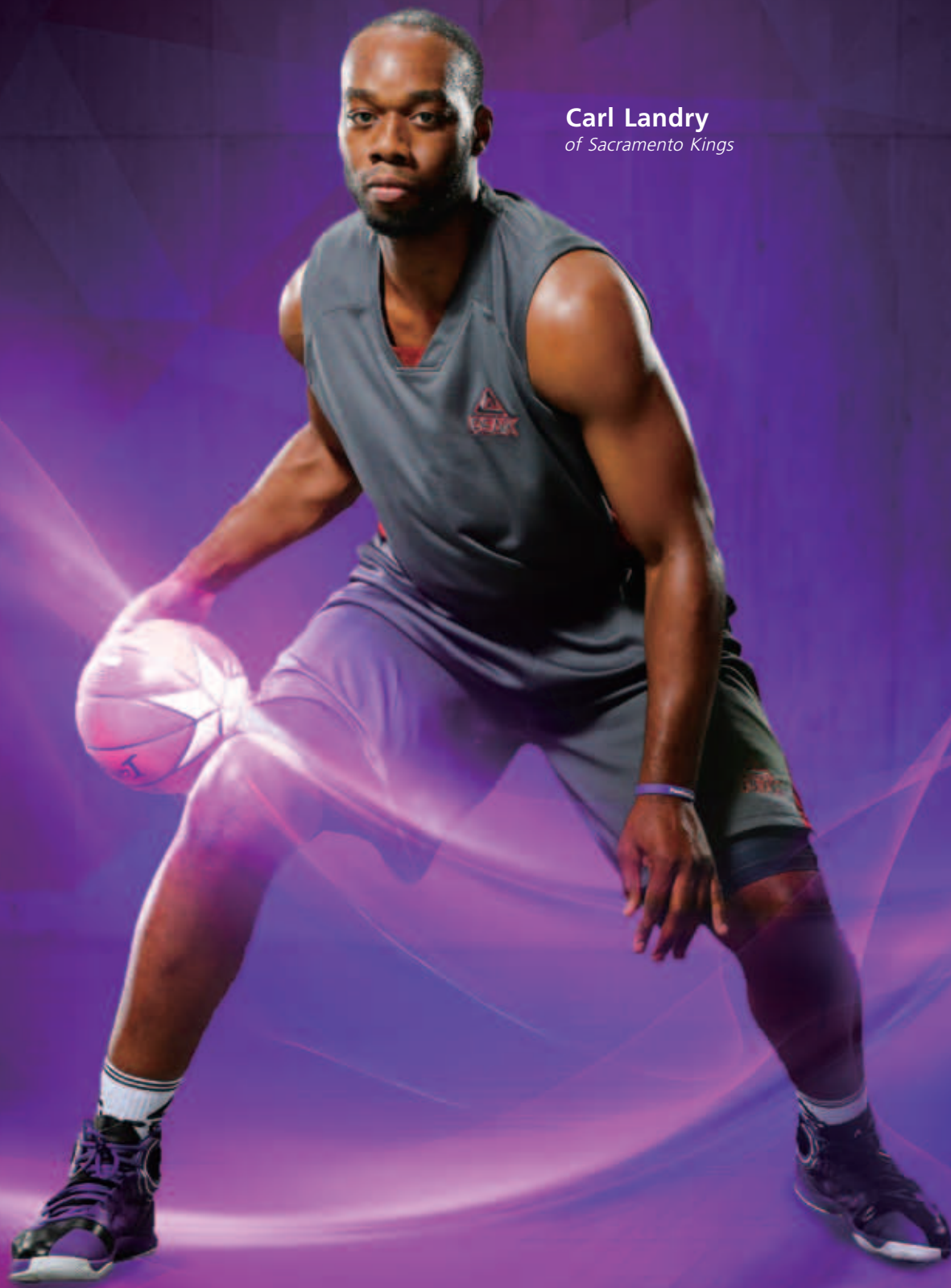
Carl Landry of Sacramento Kings