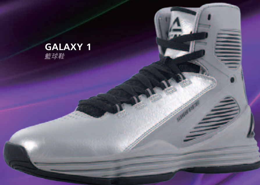
GALAXY 1 籃球鞋