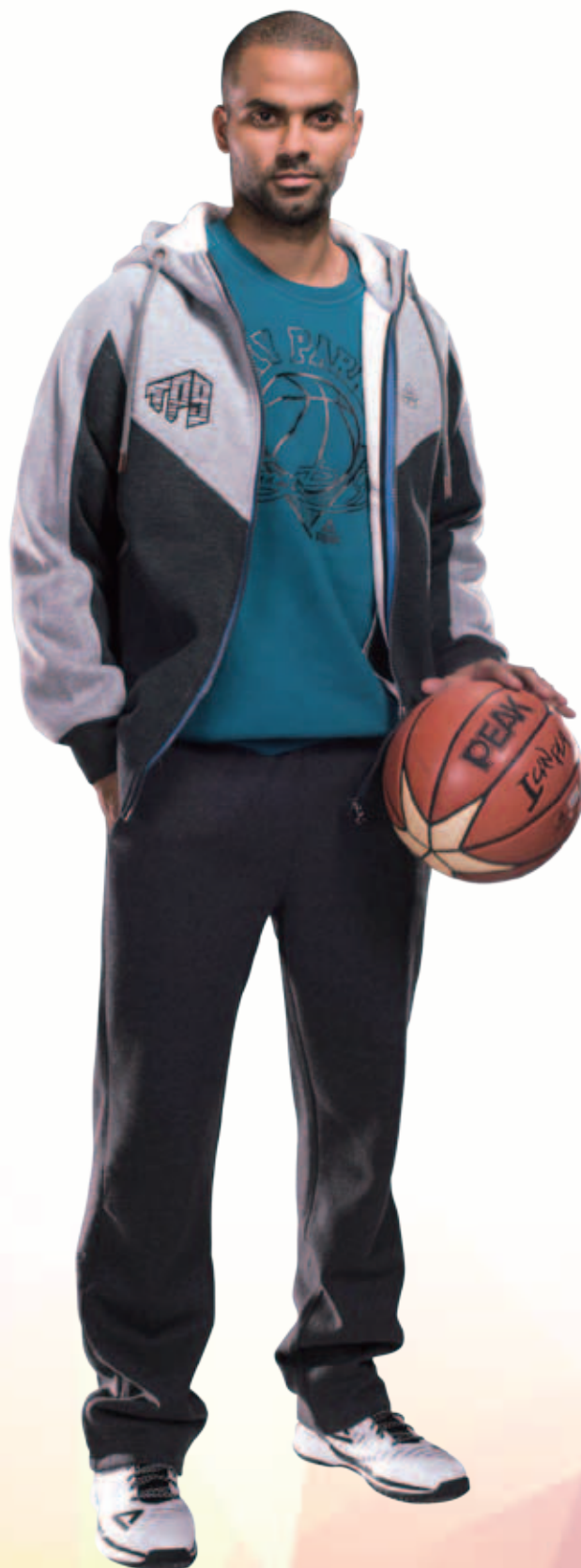
Tony Parker of San Antonio Spurs

2014年海外市場營業額的增加主要是由下列原因所導致：(i)由於當地有效的贊助及推廣活動，多個歐洲國家尤其是荷蘭、法國、德國以及斯洛伐克均錄得強勁銷售增長；(ii)亞洲銷售減少主要是因為若干中東國家政局動盪以及香港和新加坡的轉口需求減少；(iii)北美洲需求增加主要是因為美國經濟環境正在改善以及於區內引入新的分銷商；(iv)南美洲銷售減少主要是因為當地經濟環境惡化以及部分國家如巴西、阿根廷及委內瑞拉實施了外匯管制，致使入口嚴重受到限制；(v)非洲錄得銷售下降主要是因為埃及的政局動盪和若干區內國家爆發伊波拉疫症；以及(vi)大洋洲錄得輕微銷售增長主要是因為委任了一個新的澳洲分銷商。