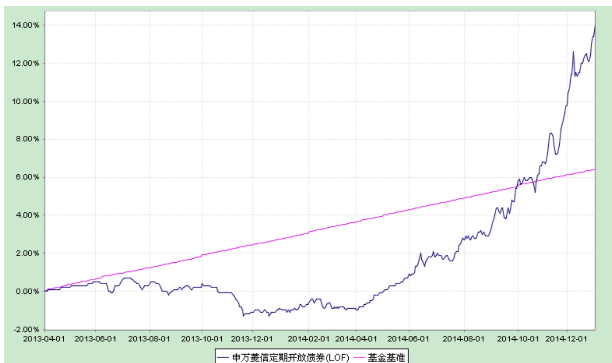
申万菱信定期开放债券型发起式证券投资基金 份额累计净值增长率与业绩比较基准收益率历史走势对比图 （2013年3月29日至2014年12月31日）