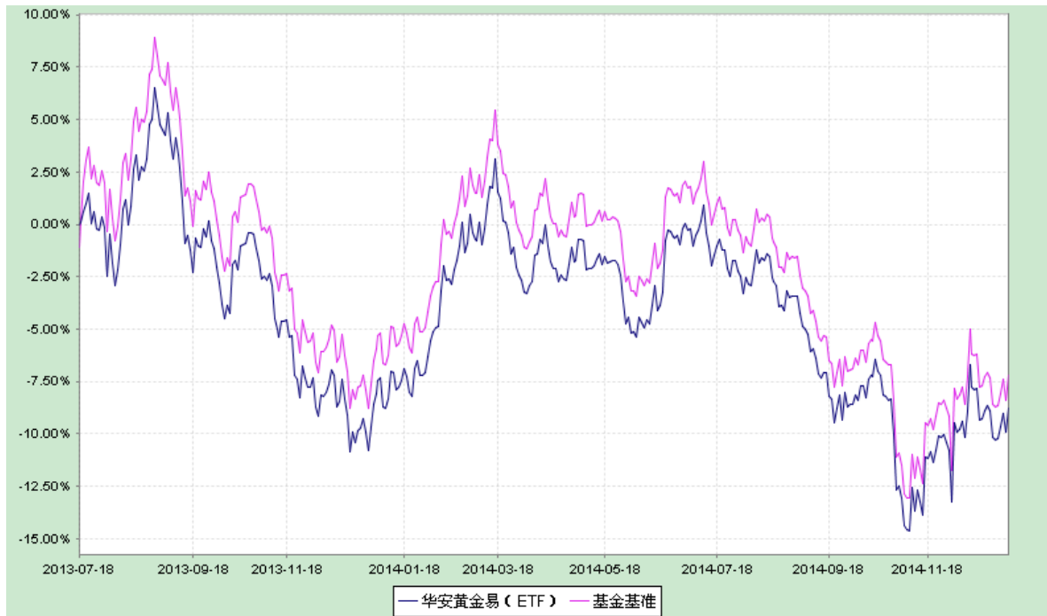
华安易富黄金交易型开放式证券投资基金 份额累计净值增长率与业绩比较基准收益率历史走势对比图 (2013 年 7 月 18 日至 2014 年 12 月 31 日)