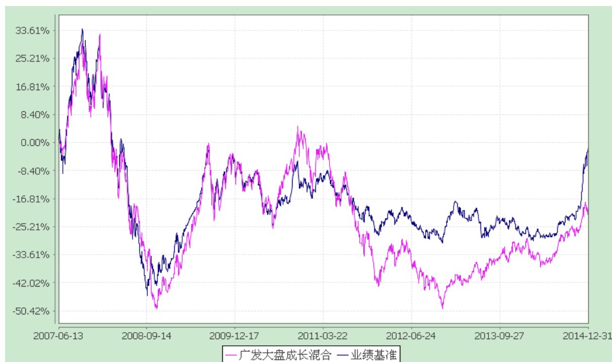
广发大盘成长混合型证券投资基金 份额累计净值增长率与业绩比较基准收益率的历史走势对比图 (2007 年 6 月 13 日至 2014 年 12 月 31 日)