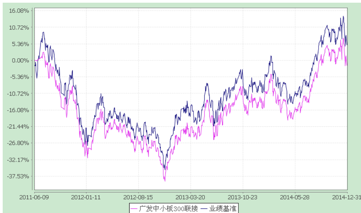
广发中小板 300 交易型开放式指数证券投资基金联接基金 份额累计净值增长率与业绩比较基准收益率的历史走势对比图 (2011 年 6 月 9 日至 2014 年 12 月 31 日)