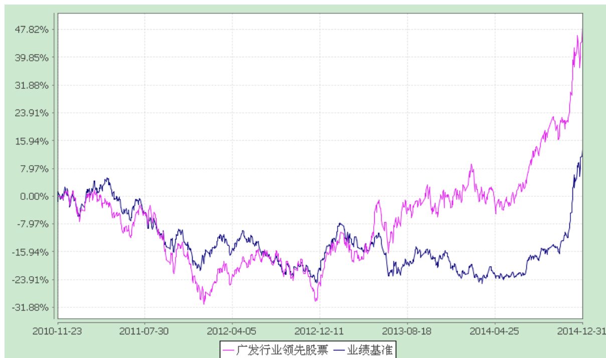
广发行业领先股票型证券投资基金 份额累计净值增长率与业绩比较基准收益率的历史走势对比图 (2010 年 11 月 23 日至 2014 年 12 月 31 日)