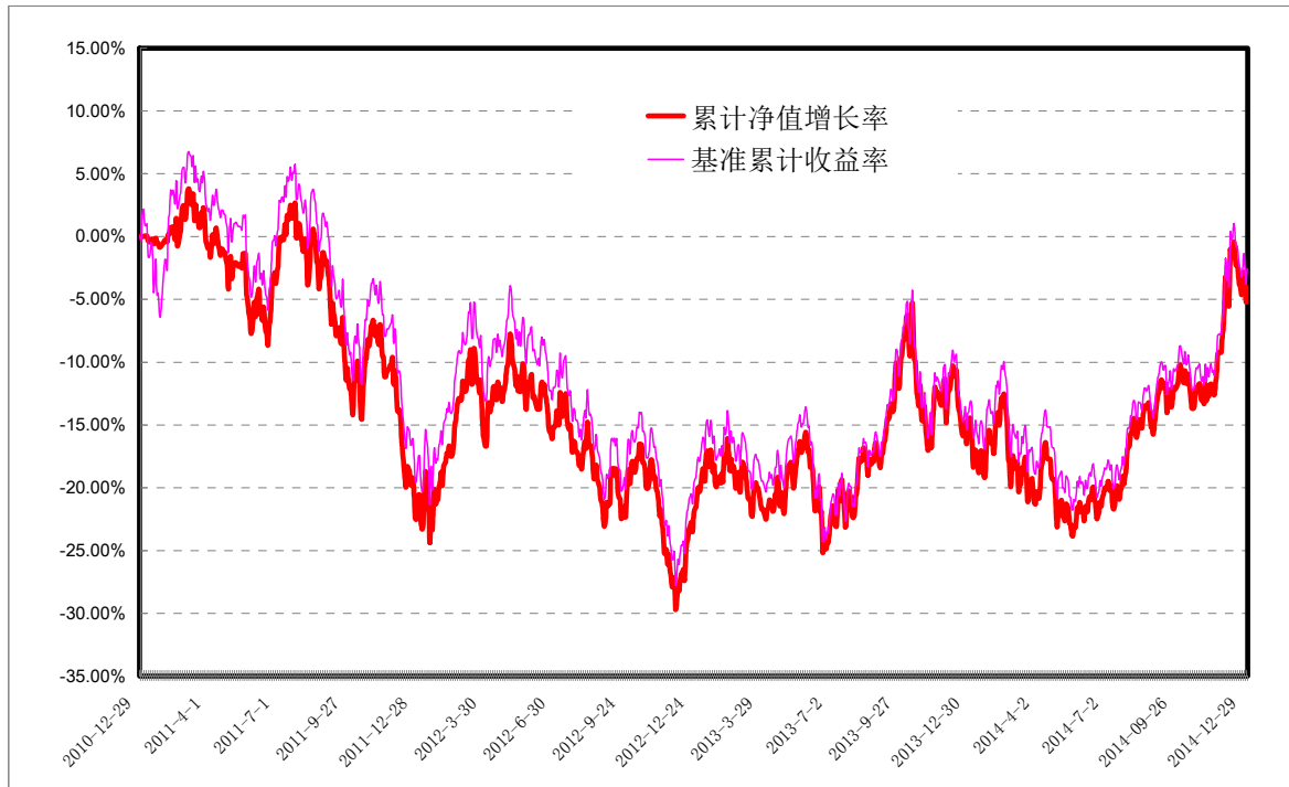
中金消费指数集合资产管理计划份额累计净值增长率 与同期业绩比较基准收益率历史走势图 (2010年12月29日至2014年12月31日)

注：本集合计划成立日为2010年12月29日，按照本集合计划合同规定，本集合计划管理人应当自集合计划投资运作期开始日起六个月内使集合计划投资组合比例符合合同的约定。建仓期结束时，本集合计划的各项资产配置比例符合本集合计划合同的有关约定。本报告期内，本集合计划的各项资产配置比例符合集合计划合同约定。