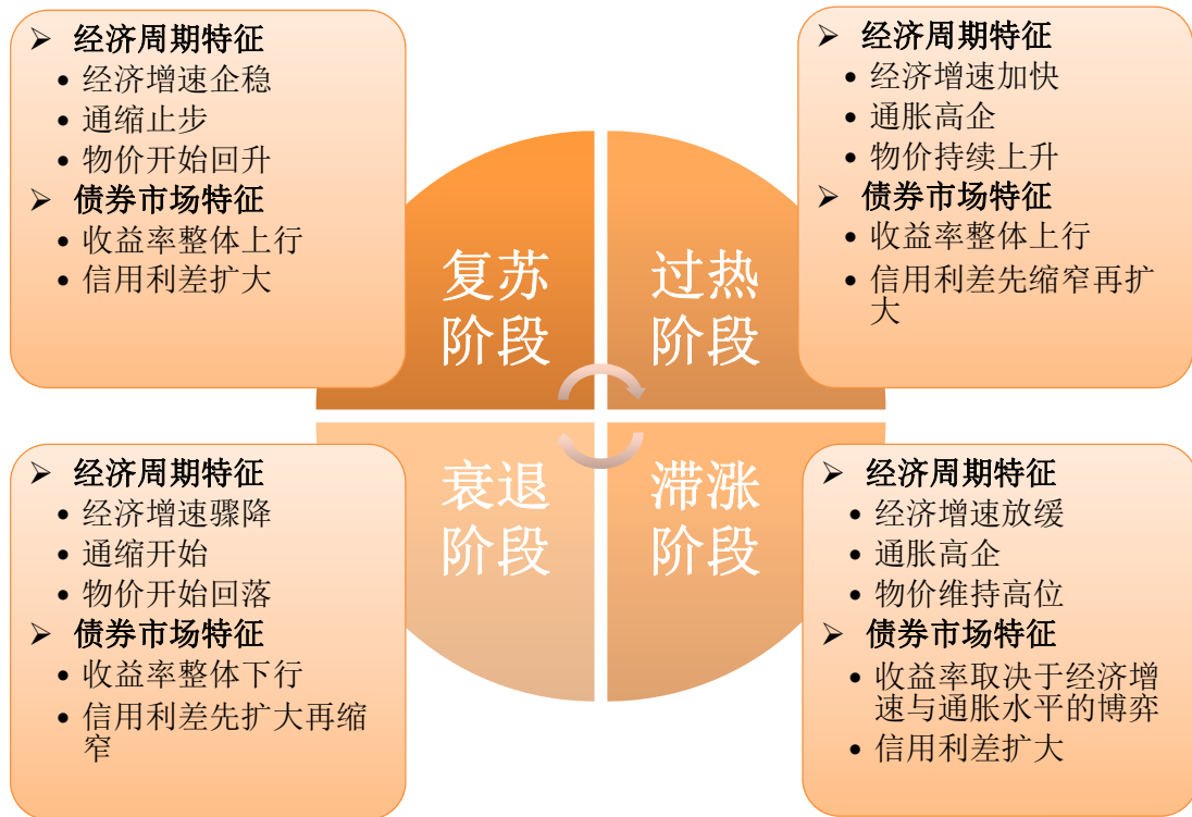
图1 宏观经济周期变动与信用利差

本基金认为，债券收益率的整体走势及信用利差随经济周期的轮动而变动，尤其是中长端收益率与低评级信用债。在复苏阶段，收益率整体呈上行态势，呈牛市变平特征；信用债的信用利差主要受债市熊市带来的流动性风险的影响，呈持续扩大趋势。在过热阶段，收益率整体呈上行态势，期限收益率曲线斜率取决于资金面的状况；初期受益于较快的经济增速，信用利差先行缩窄；中后期紧缩货币政策接连出台，若加剧了投资者对于经济前景的担忧，则信用利差止落回升。在滞胀阶段，收益率的变动趋势取决于经济增速和通胀水平两股反向力量的博弈结果；受制于经济增速下滑，企业盈利恶化，信用利差呈扩大趋势。在衰退阶段，收益率整体呈下行态势，呈牛市增陡特征；初期受经济低迷企业盈利恶化影响，信用利差先行扩大；中后期宽松货币政策接连出台，若后续经济先行指标出现企稳，投资者预期改善，则信用利差出现回落缩窄。