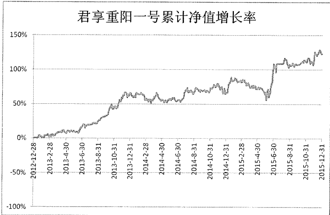
集合计划累计份额净值增长率历史走势图