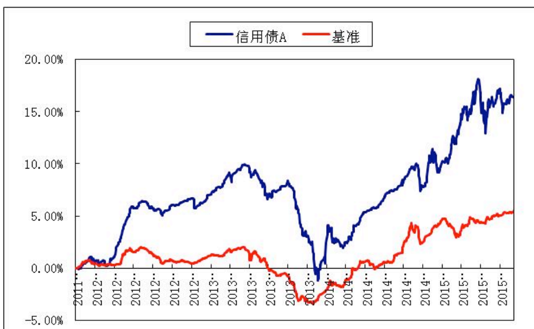
汇添富信用债债券 C