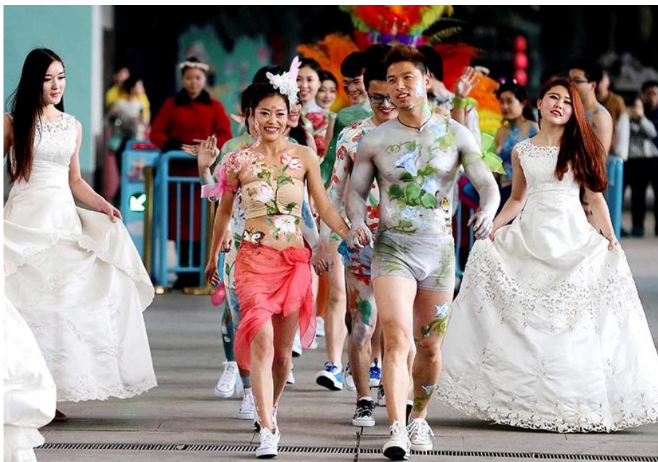
杭州乐园“裸婚”活动成为全球线上级新闻话题，点击量破亿

报告期内，公司以创意为杠杆，以新媒体为抓手，以事件营销为手段，对各大旅游区进行整合策划、整合宣传，全年策划推出了新春大庙会、花痴节、肚兜节、面具节四大主题活动；“羊年工资就不交”、“全球首创过山车裸婚典礼”等 30 余个专题活动；并转变宣传推广方式，从传统的电视、广播、报纸的硬广投入，改为更有爆炸力和传播性的事件营销的新媒体传播方式，充分利用创意的杠杆撬动传播，多个活动登上百度、新浪、腾讯、搜狐等头条，点击量频频破亿，成为全国、甚至全球的现象级话题，引发美国、韩国等多家国外媒体纷纷报道，不仅有效控制了广告投入，也极大提高了公司产品的网络曝光率。