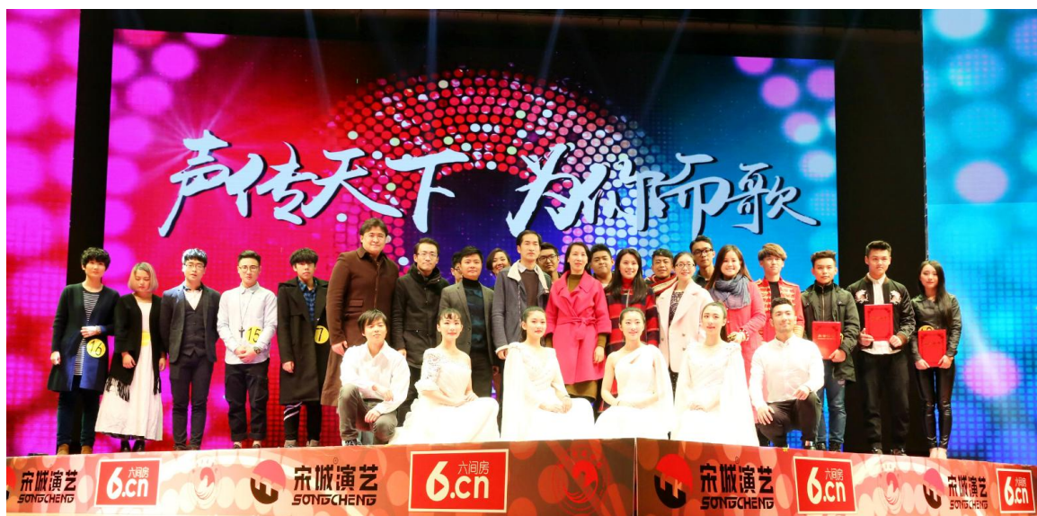
宋城演艺鼎力支持浙江传媒学院“十佳歌手”总决赛，六间房全程直播

在内容层面，截止 2015 年底，六间房签约表演者超过 8 万人，较 2014 年末增长 60%。六间房已经实现了专业内容的接入，包括宋城艺术团、嘻哈包袱铺等，未来将进一步强化形成 UGC、PUGC 和 PGC 内容的全面覆盖。与之对应，内容模式开始从“业余表演者-平台-用户”C-B-C 模式向“业余表演者-专业表演机构-平台-用户”C-B-B-C 模式和“专业表演机构-平台-用户”B-B-C 模式的延伸。