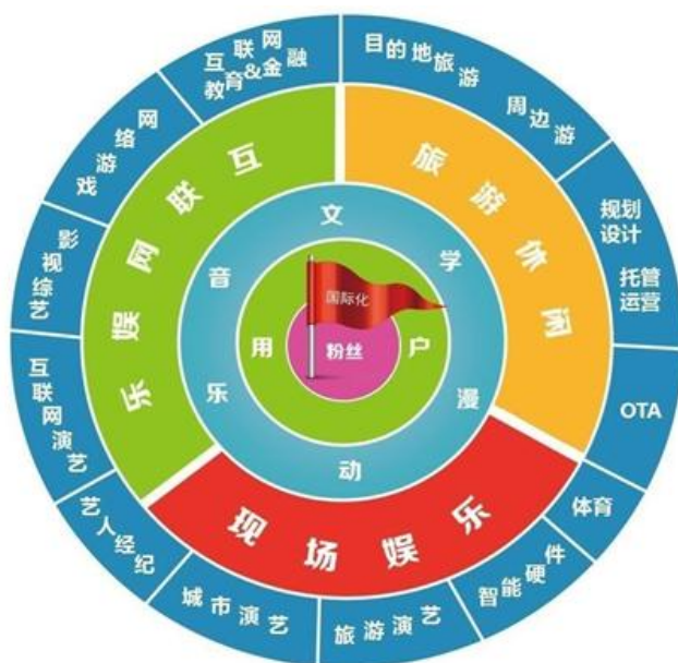
宋城演艺战略版图

公司要在三个方向实现转变，一是从过去“深挖一口井”的单业务发展向多业务协同发展转变，在继续强化现场娱乐和互联网演艺两大主业竞争优势、保持主业快速增长的前提下，挖掘新的业务增长点；二是从过去“自给自足”的全产业链生产模式向“开放共享”、“合作共赢”的资源整合型生态转换，通过业务合作和兼并收购的方式，整合社会优质资源，共同把线上线下平台做大做强；三是在人才队伍上，从过去传统企业的偏“劳动密集型”向互联网产业的“智力密集型”转变，打造更加专业化、互联网化、国际化的人才团队。