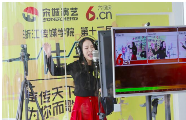
宋城演艺六间房透明直播间在高校首次亮相

2015 年，六间房月均页面浏览量达 5.34 亿，注册用户数达 3,518 万，网页端月均访问用户达到 2,857 万，较 2014 月均增长约 45%，移动端月均访问量较 2014 年增长 79.9%，年均月人均充值金额为 702 元。