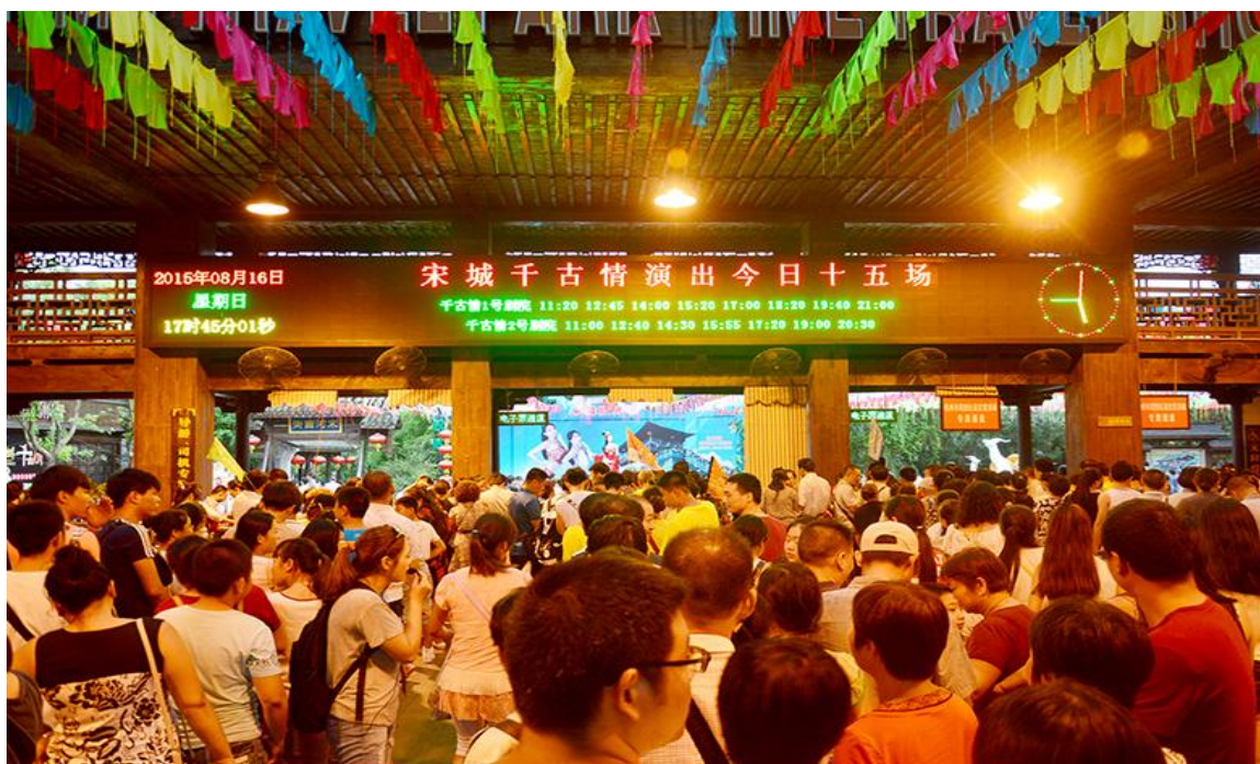
2015 年 8 月 16 日,《宋城千古情》单日 15 场创记录

报告期内,公司整体观演人数 2,233.83 万人次,大幅增长 53.42%。其中:宋城千古情观演人数增幅创近 5 年新高,8 月 16 日更是创造了单日演出 15 场的奇迹;三亚千古情观演人数同比增长 87.56%,连续第二年保持高速增长;丽江千古情观演人数同比增长 181.82%,成为增长最快的项目;九寨千古情观演人数同比增长近 60%,成为当地最具竞争力的演艺企业。