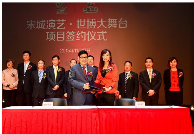
2015 年 11 月 17 日，宋城演艺签约上海

报告期内，公司通过强强联合的方式在桂林和上海实现新项目的落地，为公司未来的发展打造新的业绩增长点，同时在合作开发模式和城市演艺领域实现新突破。其中，与桂林旅游合作共建《漓江千古情》，是公司首次与行业上市公司强强联合，有望实现资源共享、优势互补。与上海世博合作，将推出《上海千古情》等全新演艺作品，进一步拓展城市人群、开发城市演艺市场，并在艺术创作、演艺形态等方面争取形成重要突破。在公司第一批异地复制项目取得巨大成功的基础上，依托公司强大的品牌和复制能力，上海、漓江项目未来必将延续爆发式的增长。