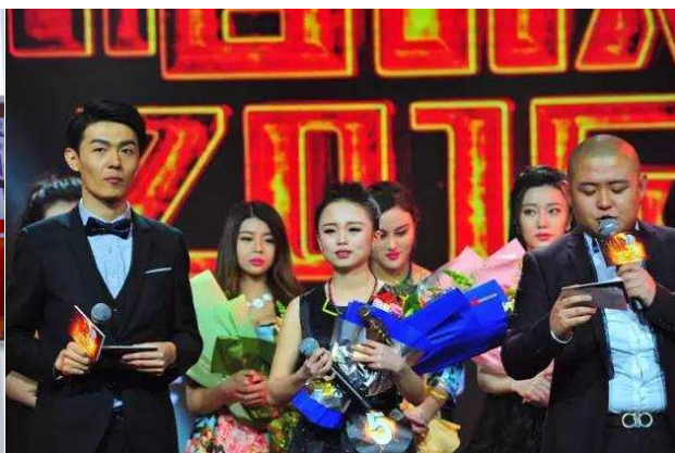
六间房 2015 年度“唱战”决赛火爆收官 19 岁大二女生夺冠