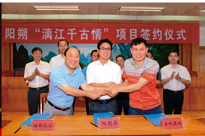
2015 年 9 月 15 日，宋城演艺签约桂林

报告期内，公司还开始尝试轻资产和收购的模式，先后控股九寨沟《藏谜》、收购福州旅游演艺资产、并以轻资产扩张模式完成了泰安项目。在项目拓展上，公司不断求新求变，由过去完全独立自主开发向资源整合与自主开发相结合的方向转变，拓宽了公司的艺术形式和种类，亦使公司线下流量入口加速发展。