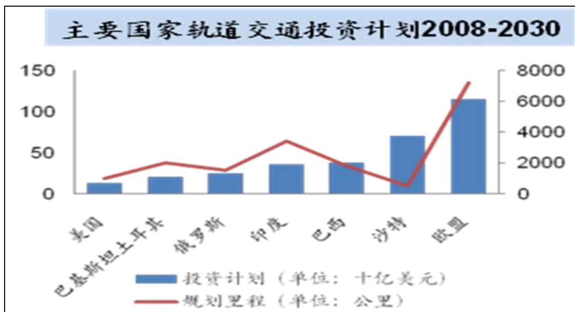
2008~2030 年 6 个国家和欧盟轨道交通设施投资和规划里程示意图

在国际市场方面，随着全球人口膨胀和城市化进程加快，决定了全球经济对交通基础设施建设，特别是轨道交通建设存在长期的需求。从 2008 年开始的全球经济萧条，并没有对轨道交通行业产生影响，反而在各国拉动内需的投资计划下促使其迎来新一轮高潮。未来十年，由于世界各国纷纷出台经济刺激计划，交通基建投资将增至 3,309 亿美元。2020~2030 年，预计新增投资仍将增长，达到 3,414 亿美元。（资料来源：欧洲铁路工业协会《2016 年国际铁路行业展望》）