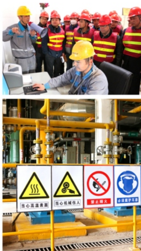
总结推广安全标准化示范企业—礼泉海螺的示范创建经验