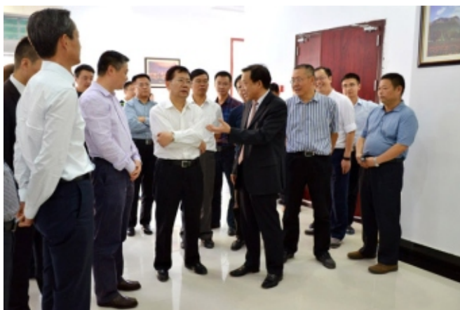
中央委员、三峡办主任聂卫国到重庆海螺视察垃圾处理项目

公司在推广水泥窑协同处理生活垃圾技术方面所做贡献得到社会各界的高度赞扬与肯定，2015年，国家发改委、工信部、财政部等六部委联合确定铜陵海螺和贵定海螺为水泥窑协同处置生活垃圾全国试点企业。