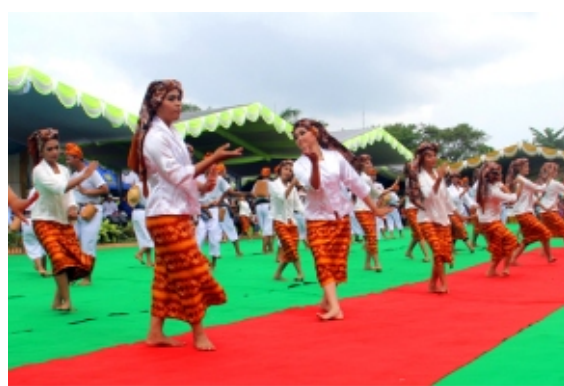
海外项目公司积极参加当地重大节日活动

开展丰富多彩的员工文娱活动： 公司注重丰富员工的业余生活，全年多次组织体育竞赛和文艺晚会等活动，举办机关部室单身员工联谊活动，为单身青年员工搭建沟通交流平台。同时，公司在推进国际化战略的过程中重视与海外文化的融合，尊重项目所属国的宗教信仰和文化传统，积极参加当地重大节日活动，邀请当地居民共庆中国传统节日，增进本国员工与外籍员工的理解和交流，促进文化交融。通过系列文娱活动的开展，提升了员工的幸福感和归属感，增强了公司的凝聚力和向心力。