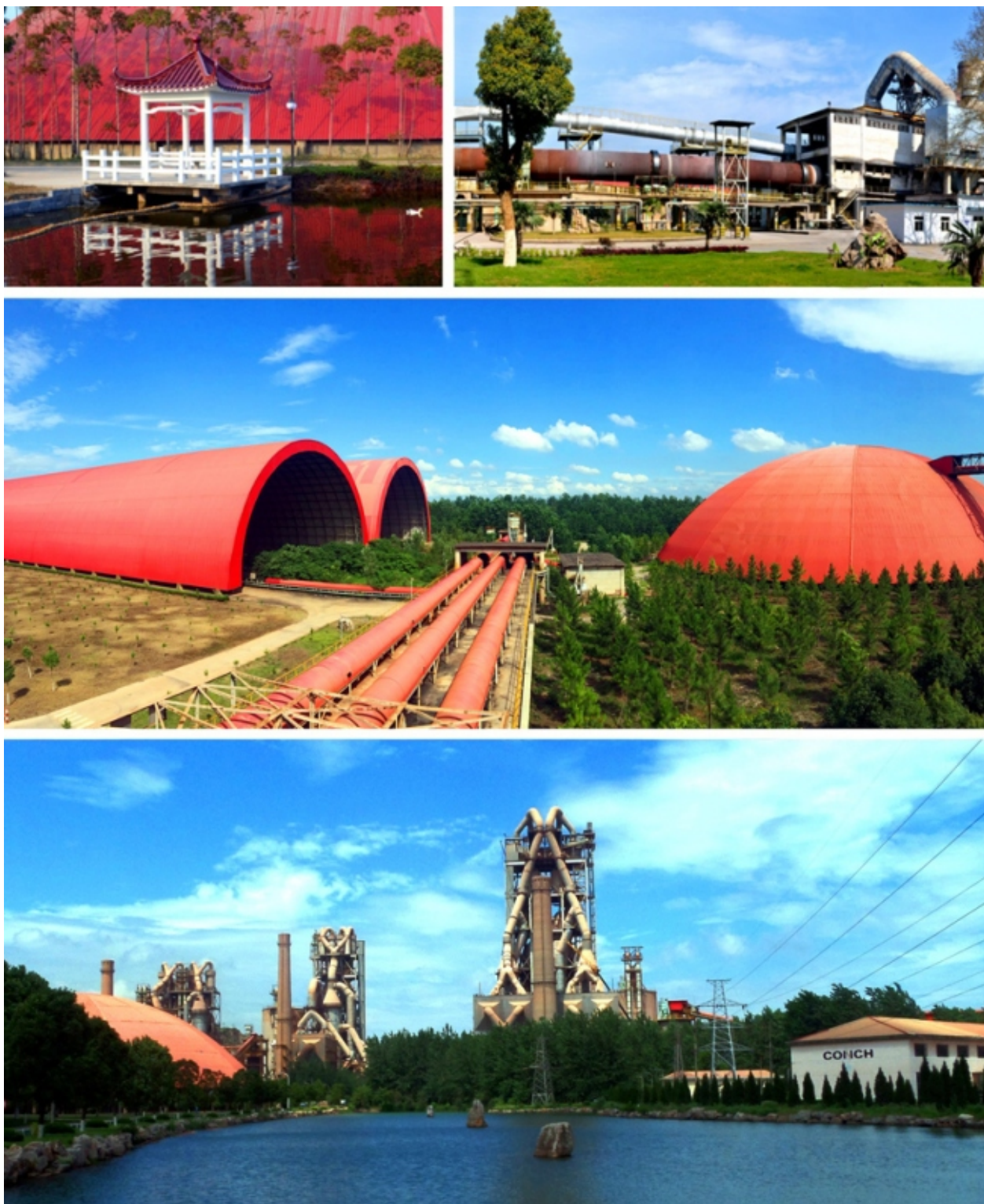
风景如画的海螺生态环保工厂