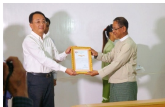
缅甸海螺积极行动，捐款救灾