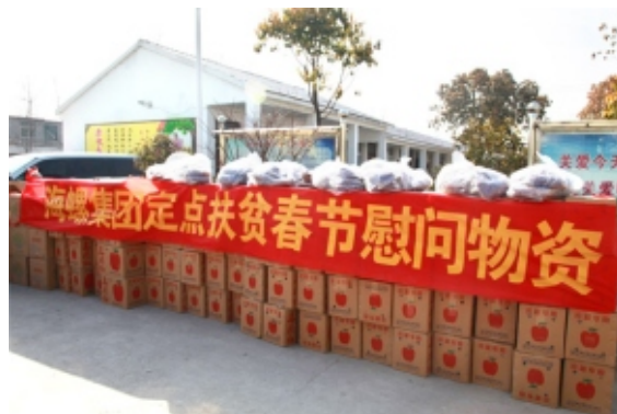
海螺开展定点扶贫慰问活动

积极参与社会公益活动： 2015年，公司继续投身敬老爱幼、扶弱助残、义务帮扶等活动：扶绥海螺组织青年志愿者服务队开展下乡义务维修活动；兴安海螺向当地小学捐赠书籍和学习用品；乾县海螺资助10名贫困大学生圆了大学梦；平凉海螺出资改造当地乡村公路，改善当地居民出行条件。小事显大