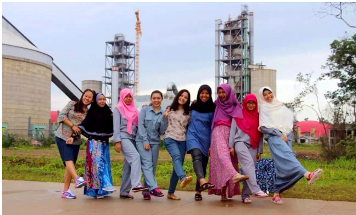
加强文化融合，提升员工的幸福感和归属感