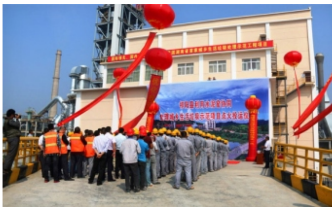
湖南首家利用水泥窑协同处理城乡生活垃圾示范项目在祁阳海螺点火投运