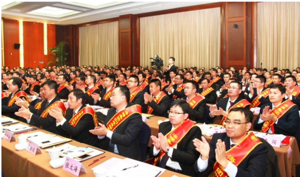
表彰先进典型，激发干部员工干事创业热情