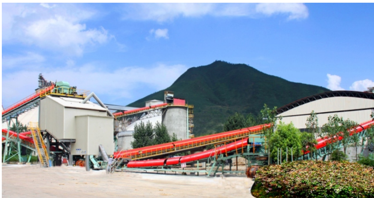
采用密闭式输送设备，有效控制粉尘排放

推进粉尘减排： 为响应国家大气污染防治行动计划，确保粉尘排放浓度长期稳定达标，公司坚持对收尘设备实施升级改造，报告期内新建生产线收尘设备均严格按照不高于 30\text{mg}/\text{m}^3 的国家标准进行配置，原有生产线的收尘设备按国家标准进行改造升级，全年共完成83台电收尘器的高压控制系统升级改造。同时，在产品包装和发运环节，通过采用密闭式输送设备、降低物流转运高度落差等措施使粉尘排放得到有效控制，经各地环境检测站监测，公司所有生产线均实现粉尘达标排放。