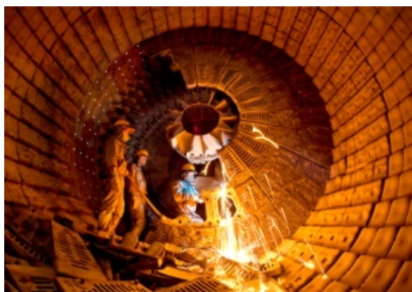
实施技术改造，努力挖潜增效

消纳工业废弃物： 公司在产品生产过程中重视资源综合利用，凭借先进的技术和管理优势，大量消纳粉煤灰、脱硫石膏、碎屑和铁尾渣等工业废渣，实现工业废弃物再利用。报告期内，共消纳各类工业废渣4604万吨，较2014年增加了689万吨，截至报告期末，公司已累计消纳各类工业废弃物1.92亿吨。