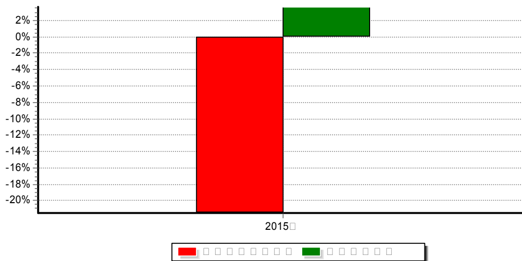
自基金合同生效以来基金每年净值增长率与同期业绩比较基准收益率的对比图 (2015年2月10日-2015年12月31日)

注：1、本基金基金合同生效日为2015年2月10日，至本报告期末未满5年。 2、合同生效当年按实际存续期计算，不按整个自然年度进行折算。