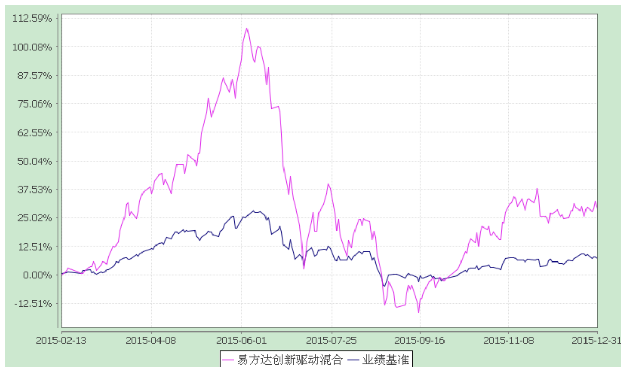
易方达创新驱动灵活配置混合型证券投资基金 份额累计净值增长率与业绩比较基准收益率历史走势对比图 (2015 年 2 月 13 日至 2015 年 12 月 31 日)

注：1.本基金合同于 2015 年 2 月 13 日生效，截至报告期末本基金合同生效未满一年。