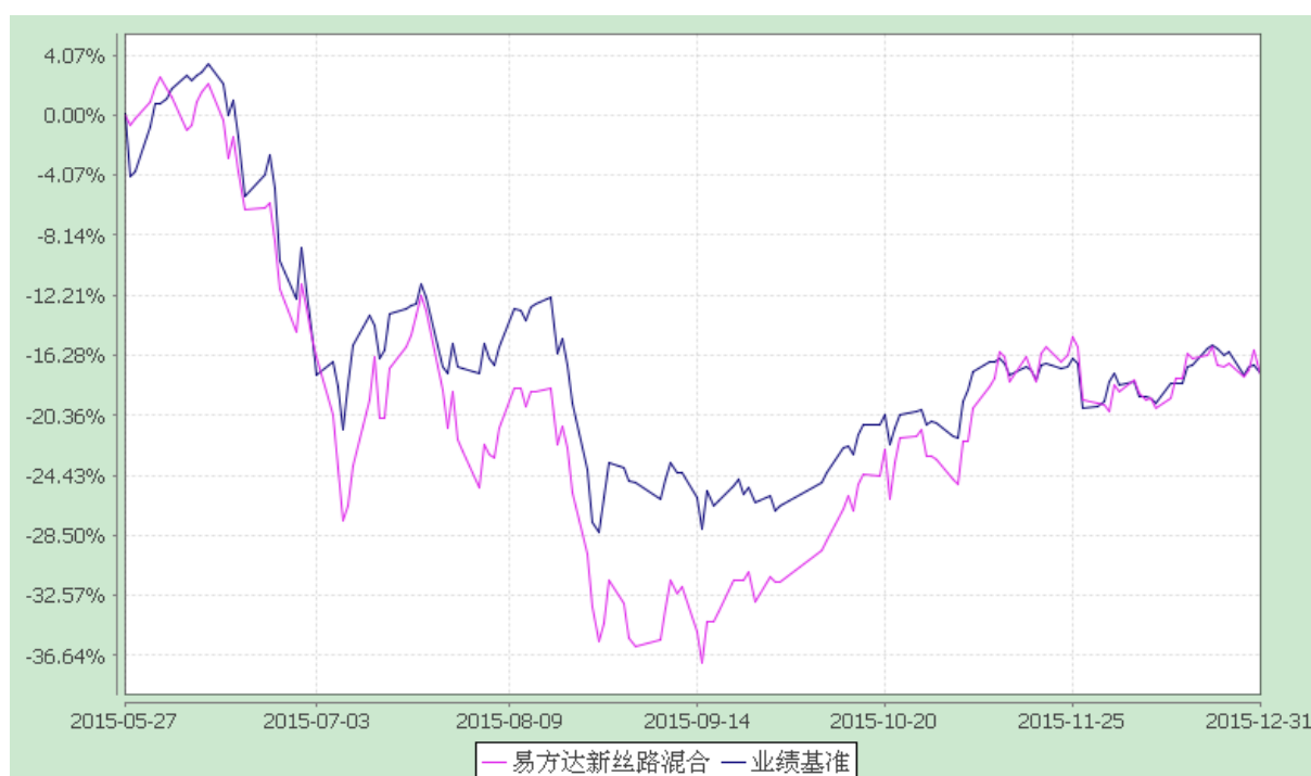
易方达新丝路灵活配置混合型证券投资基金 份额累计净值增长率与业绩比较基准收益率历史走势对比图 (2015年5月27日至2015年12月31日)

注：1. 本基金合同于2015年5月27日生效，截至报告期末本基金合同生效未满一年。