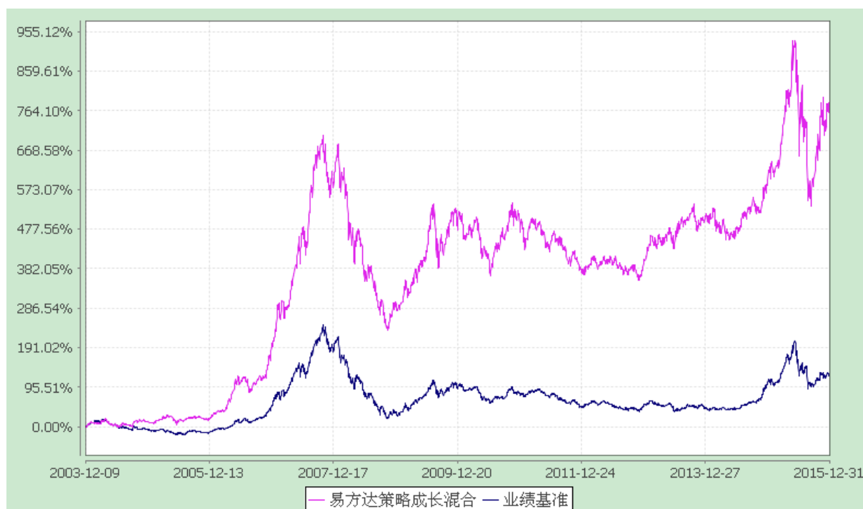
易方达策略成长证券投资基金 份额累计净值增长率与业绩比较基准收益率历史走势对比图 (2003 年 12 月 9 日至 2015 年 12 月 31 日)

注：自基金合同生效至报告期末，基金份额净值增长率为 766.34%，同期业绩比较基准收益率为 124.15%。