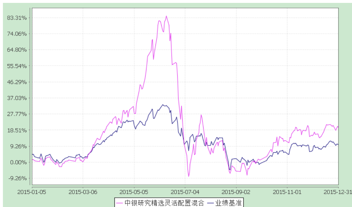
中银研究精选灵活配置混合型证券投资基金 份额累计净值增长率与业绩比较基准收益率的历史走势对比图 (2014 年 12 月 23 日至 2015 年 12 月 31 日)

注：按基金合同规定，本基金自基金合同生效起 6 个月内为建仓期，截至建仓结束时本基金的