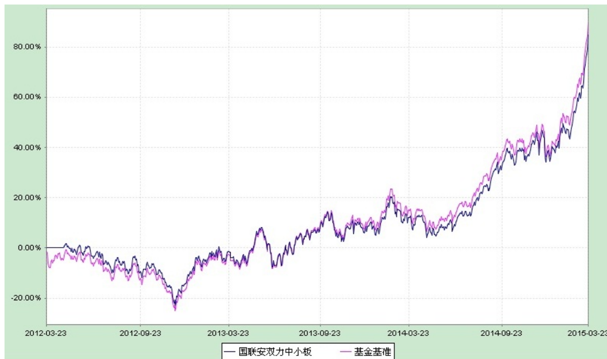
国联安双力中小板综指分级证券投资基金 份额累计净值增长率与业绩比较基准收益率的历史走势对比图 (2012 年 3 月 23 日至 2015 年 3 月 23 日)

注：1、本基金份额转换日为 2015 年 3 月 23 日，在转换日日终，国联安双力中小板综指分级证券投资基金之 A 份额（基金代码：150069）、国联安双力中小板综指分级证券投资基金之 B 份额（基金代码：150070）的基金份额以各自的基金份额为基准转换为国联安双力中小板综指证券投资基金（LOF）的基金份额。自 2015 年 3 月 24 日起，本基金的基金名称变更为“国联安双力中小板综指证券投资基金（LOF）”；