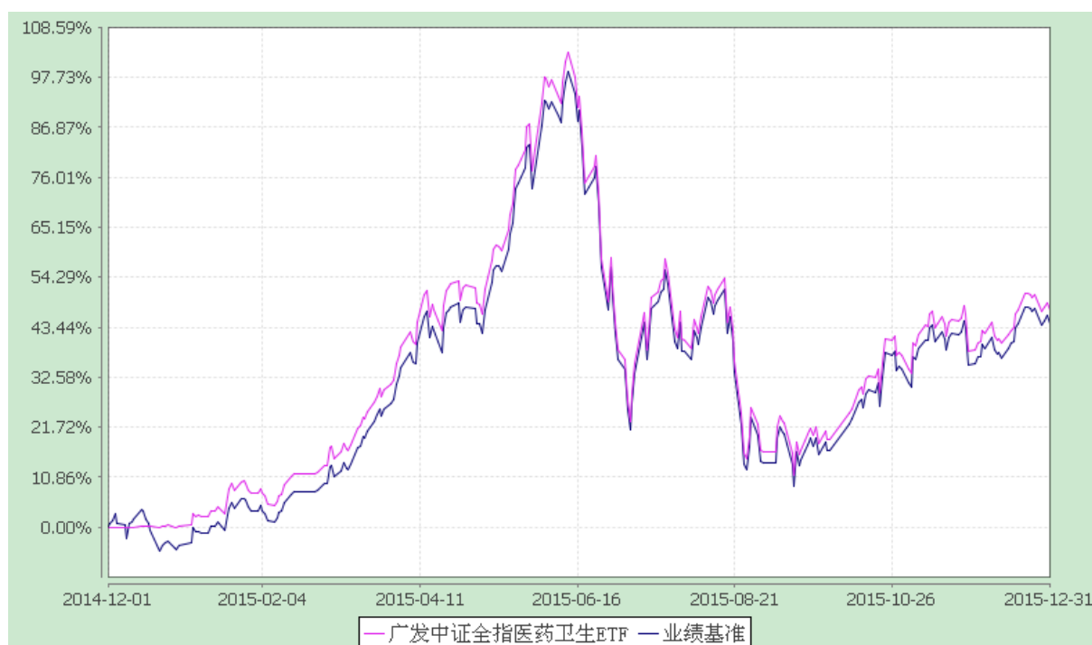
广发中证全指医药卫生交易型开放式指数证券投资基金 份额累计净值增长率与业绩比较基准收益率的历史走势对比图 (2014 年 12 月 1 日至 2015 年 12 月 31 日)