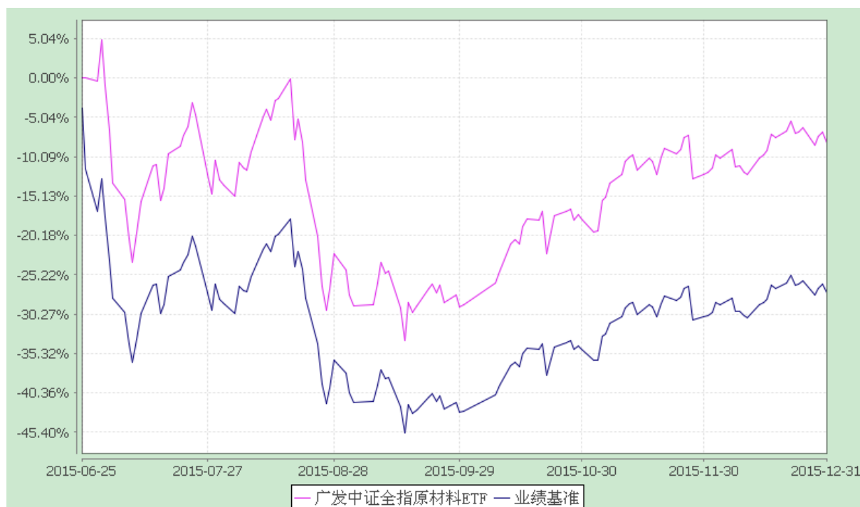
广发中证全指原材料交易型开放式指数证券投资基金 份额累计净值增长率与业绩比较基准收益率的历史走势对比图 (2015 年 6 月 25 日至 2015 年 12 月 31 日)