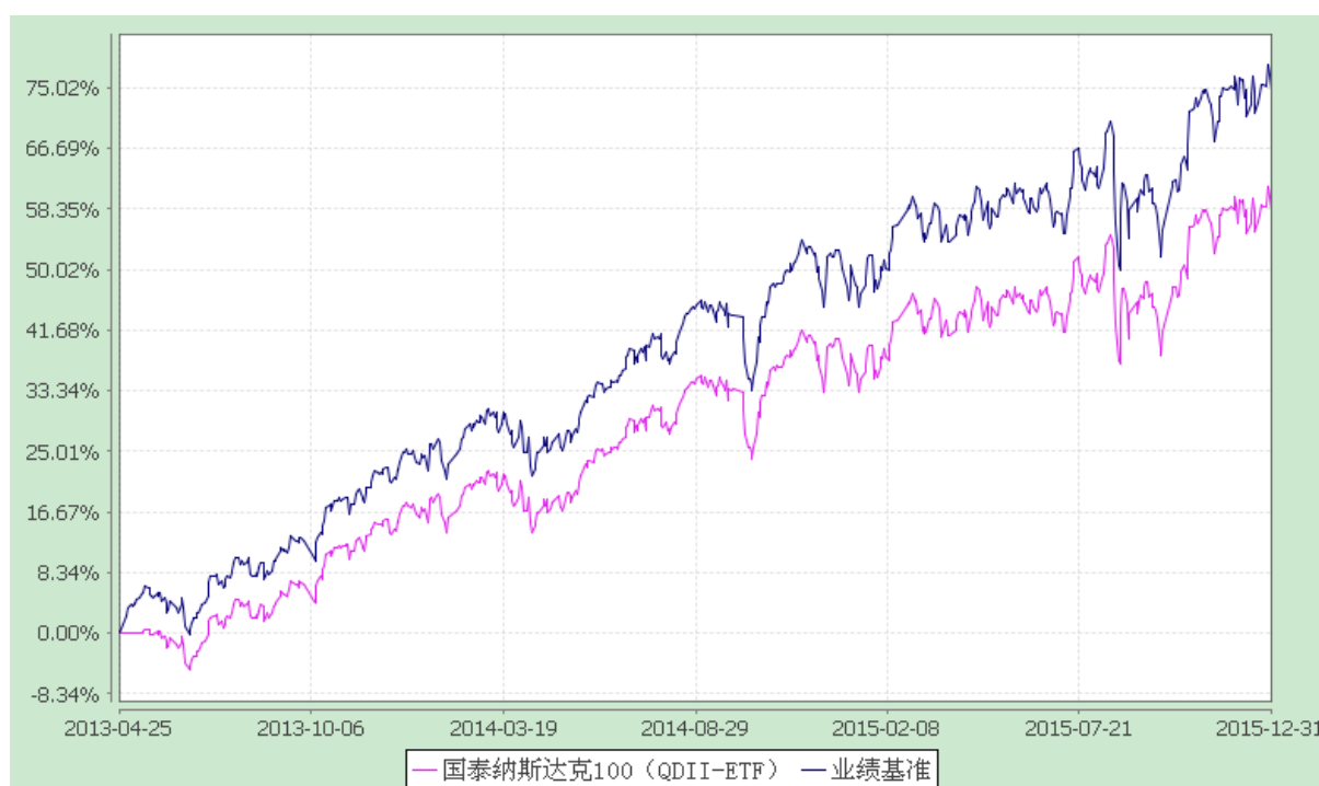
纳斯达克 100 交易型开放式指数证券投资基金 份额累计净值增长率与业绩比较基准收益率历史走势对比图 (2013 年 4 月 25 日至 2015 年 12 月 31 日)

注：（1）本基金合同生效日为 2013 年 4 月 25 日。本基金在 3 个月建仓期结束时，各项资产配置比例符合合同约定。