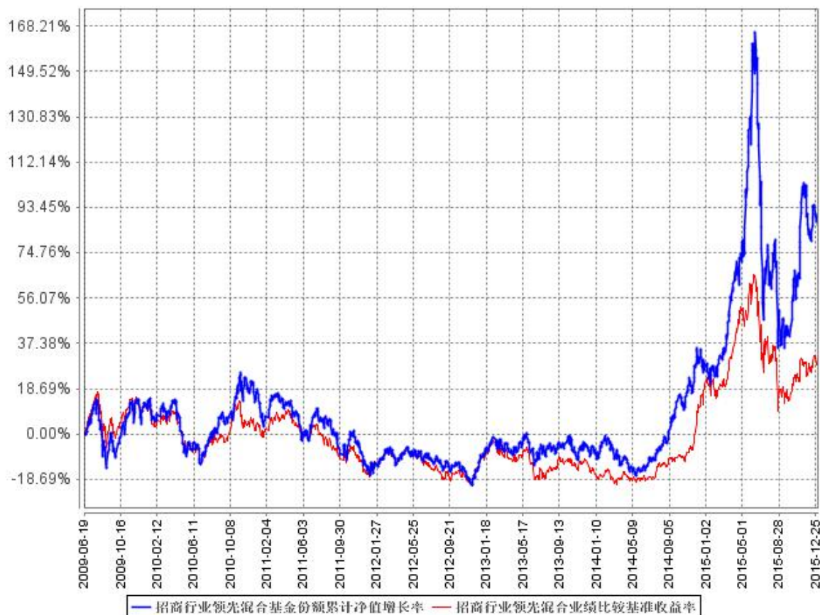
招商行业领先混合基金份额累计净值增长率与同期业绩比较基准收益率的历史走势对比图

注：根据基金合同的规定：本基金将基金资产的 60-95% 投资于股票等权益类资产（其中，权证投资比例不超过基金资产净值的 3%），将基金资产的 5-40% 投资于现金和债券等固定收益类资产（其中，现金或到期日在一年以内的政府债券不低于基金资产净值的 5%）。本基金于 2009 年 6 月 19 日成立，本基金的建仓期为 2009 年 6 月 19 日至 2009 年 12 月 18 日，建仓期结束时相关比例均符合上述规定的要求。