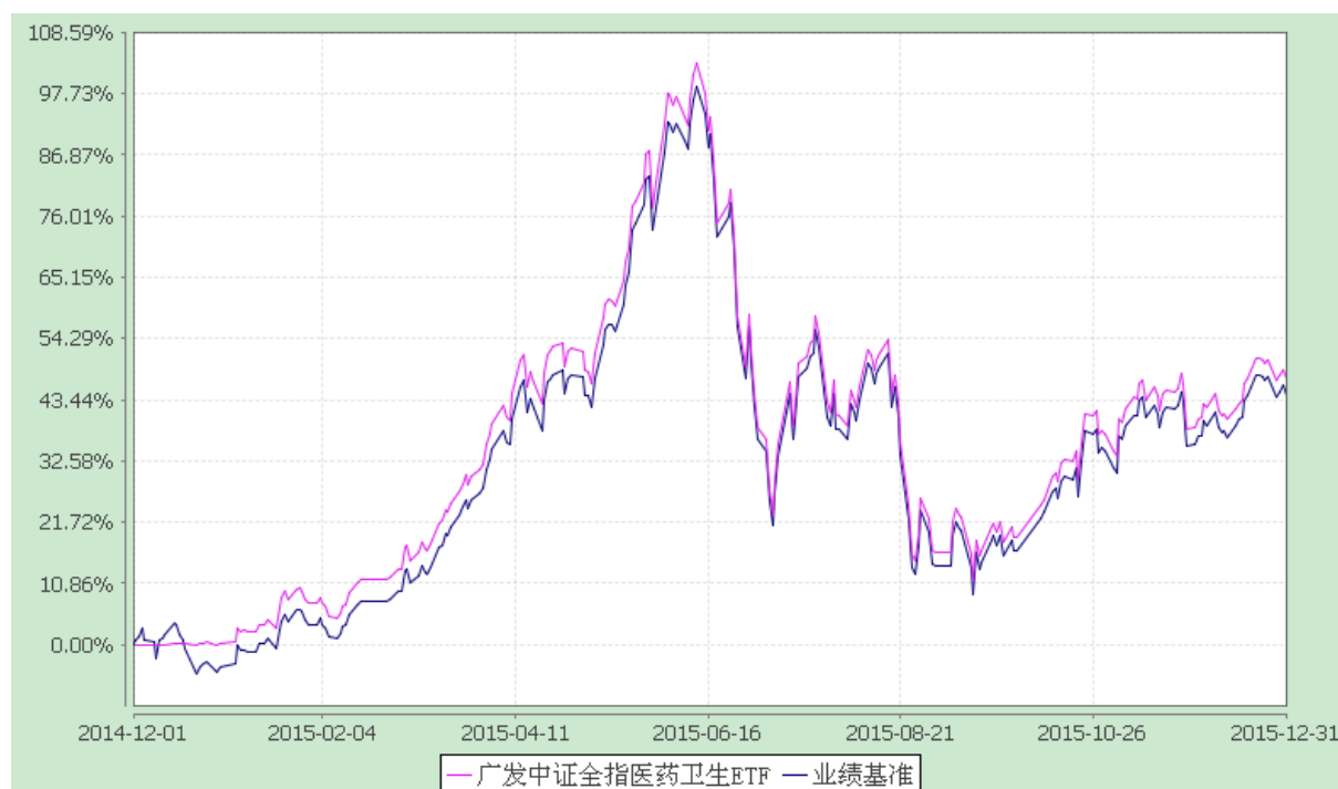
广发中证全指医药卫生交易型开放式指数证券投资基金 份额累计净值增长率与业绩比较基准收益率的历史走势对比图 (2014 年 12 月 1 日至 2015 年 12 月 31 日)

注：本基金建仓期为基金合同生效后 3 个月，建仓期结束时各项资产配置比例符合合同约定。